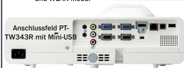
Anschlussfeld PT-TW343R mit Mini-USB