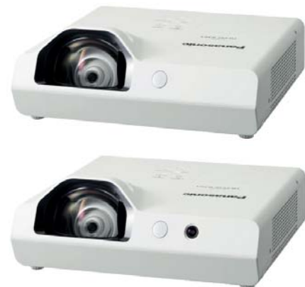
PT-TW343R mit Kamera für Interaktivität

Im Modell PT-TW343R ist zudem eine Kamera integriert. Sie erkennt, wenn mit dem mitgelieferten interaktiven Stift (mit Infrarot-Sensor) auf der Projektionsfläche geschrieben, gezeichnet oder etwas markiert wird und projiziert die entsprechende Eingabe und bietet so interaktive Whiteboard-Funktionalität .