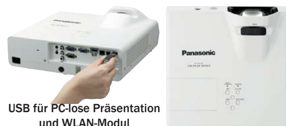
USB für PC-lose Präsentation und WLAN-Modul