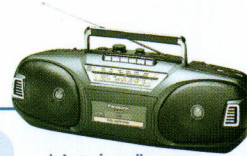
موسیقی پشت خط