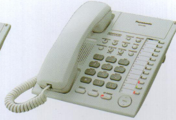
KX-T7720 با نشانگر نورانی و بلندگو