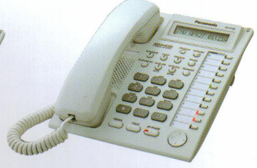
KX-T7730 با صفحه نمایش LCD و بلندگو