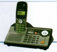
تلفن بی سیم