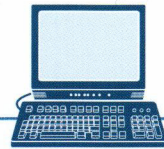
دسترسی به کامپیوتر