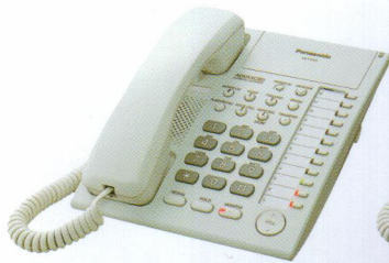
KX-T7750 با بلندگوی یکطرفه