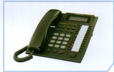
* یک کارت اختیاری مورد نیاز است.

امکان تنظیم زاویه پایه دستگاه جهت استفاده راحت تر و اشغال کمتر فضا، از دو زاویه می توان پایه تلفن را تنظیم نمود.